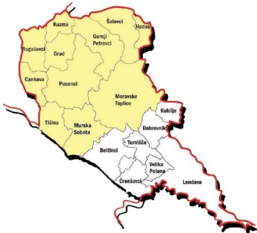
Slika 1: Območje LAS Goričko v letu 2014