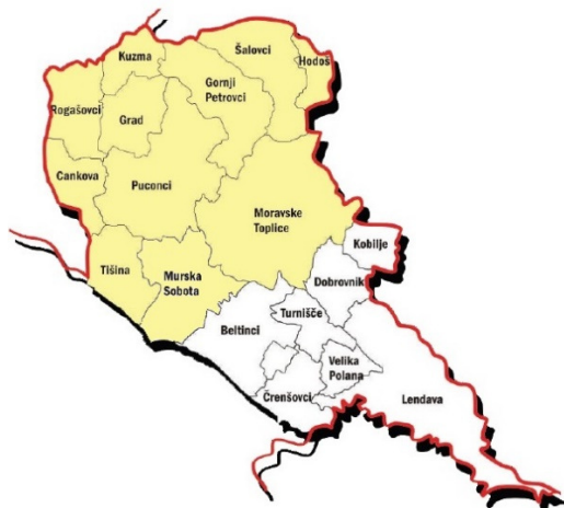
Slika 1: Območje LAS Goričko v letu 2014