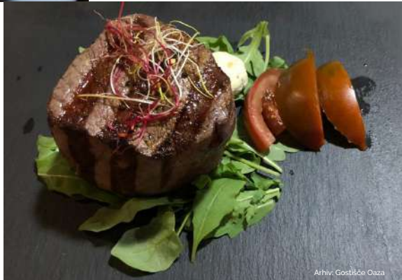
Arhiv: Gostišče Oaza

☎ +386 51 383 141 ✉ oazagrill@gmail.com 🌐 www.oazagrill.com/SI/