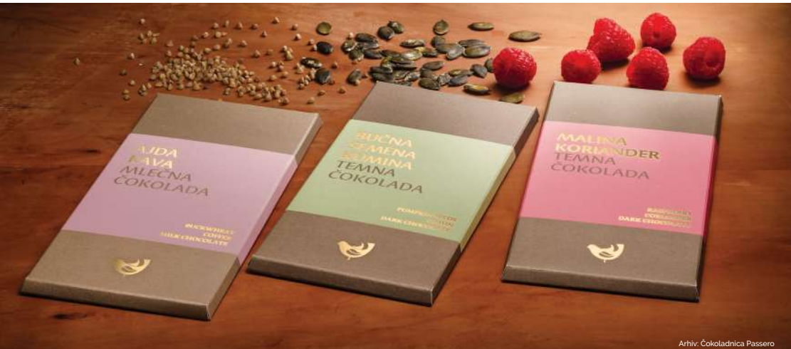
Arhiv: Čokoladnica Passero