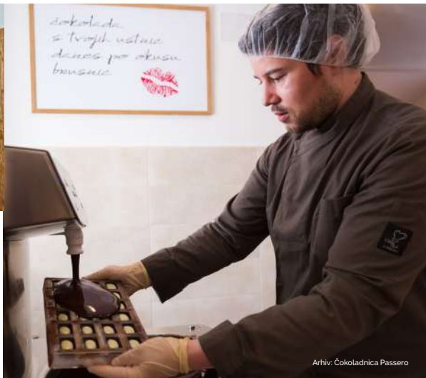
Arhiv: Čokoladnica Passero