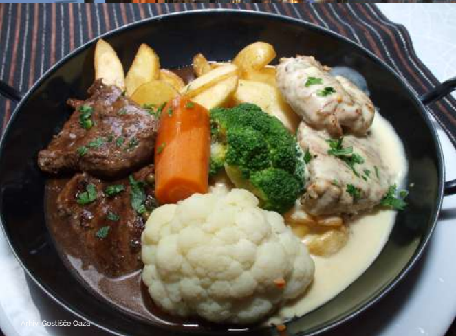
Arhiv: Gostišče Oaza